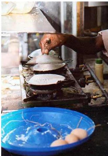
MARCHAND DE CREPES

Si elle ne figure pas parmi les meilleures d'Asie, la cuisine sri lankaise est savoureuse et d'excellente qualité. Le plat de base est le curry servi avec du riz. Une des spécialités est préparée à base de curry classique, de lait de noix de coco, d'oignons en tranche, de chili vert, d'épices aromatiques comme la girofle, la muscade, la cannelle et le safran. Les hoppers sont un hybride entre le muffin et la crêpe avec une gaufrette croustillante, servis avec un oeuf frais à peine cuit dessus. Le rotty , mélange de toutes sortes d'ingrédients (oeuf, oignons, jambon, piments...) enveloppés dans une sorte de crêpe élastique, est un en-cas bourratif que l'on trouve sur tous les étals.