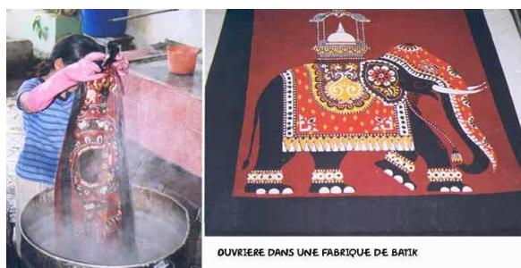
OUVRIERE DANS UNE FABRIQUE DE BATIK