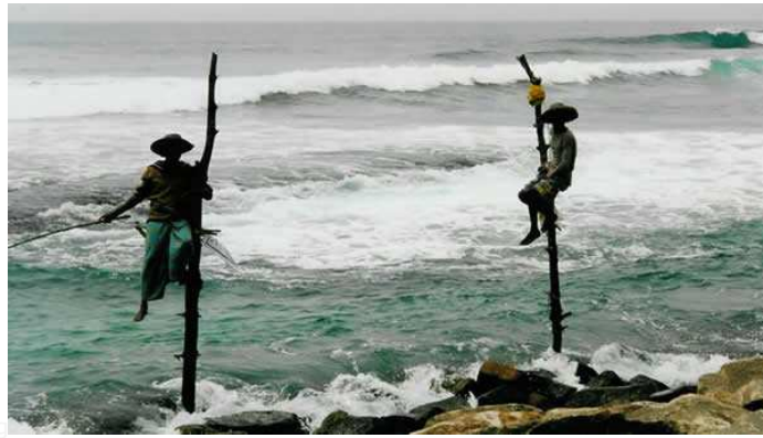
] Pêcheurs sur échasses