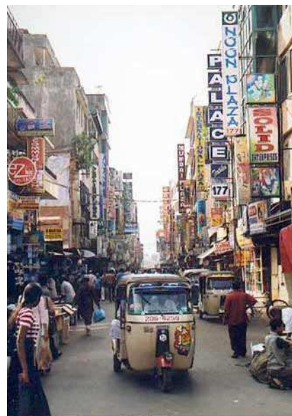
Ville de Colombo