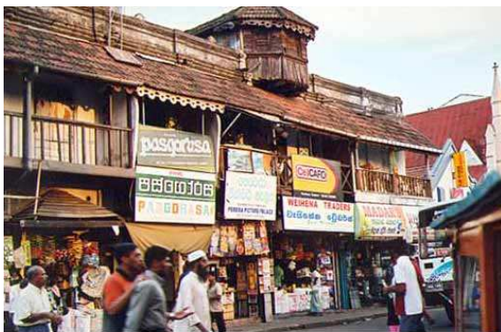
Ville de Kandy