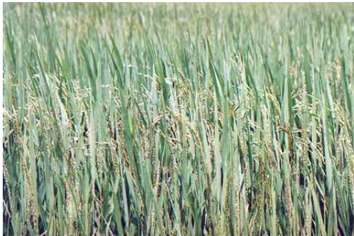
CHAMP DE RIZ