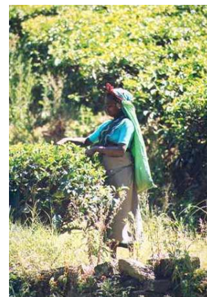
CUEILLEUSE DE THE