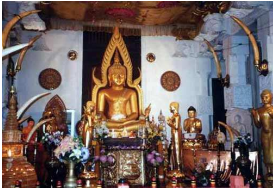
Temple de la dent à Kandy

L'architecture sri lankaise a créé son propre style, relativement inchangé au cours des siècles : le dagoba , monument bouddhique composé d'un hémisphère plein contenant des reliques de Bouddha, en est le plus remarquable élément.