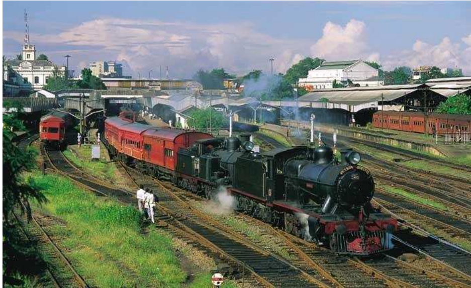
Le train, héritage des anglais